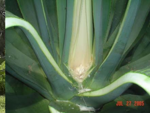
El Corazón del Maguey