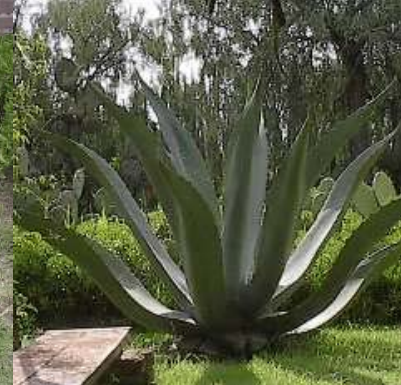
Tlacometl Señor Maguey