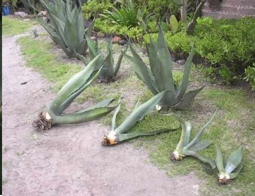
4 tamaños del maguey